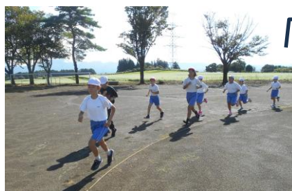
9月3日の柳沢 チャレンジから

8月27日から小学校の「柳沢チャレンジ」が再開しました。体力向上を目指していろいろな内容に取り組んでいますが、今回の内容は 長距離走 です。9月25日に行われる 校内ロードレース大会 に向けて、これから走り込みを中心に取り組んでいきます。柳沢チャレンジの初日は残念ながら雨模様。このため、体育館でランニングをたっぷりしました。中学生に柳沢チャレンジの時間はありませんが、時間を見つけながら、各自走り込み等の準備をしてほしいと思います。しばらく残暑は続きます。体調に気を付けつつ、体力向上そして自己ベストの更新へ向けてがんばりましょう。