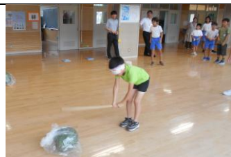
うまい！夏の終わりにスイカ割り