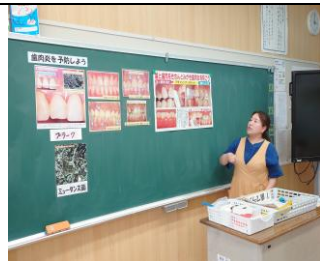
歯肉炎は歯を失う原因です。 (歯科指導より)